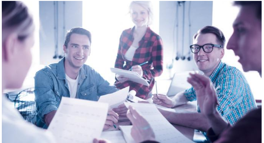
Aktionärbindungsvertrag: ein sinnvolles Instrument, um in guten Zeiten vorausschauende Regelungen für schwierige Phasen zu definieren.

Fast alle Aktionärbindungsverträge sehen Veräusserungsbeschränkungen vor, gerade in Familienbetrieben und Aktiengesellschaften mit wenigen Aktionären. Beispielsweise erwirbt man mit einem Kaufrecht das Recht, Aktien zu erwerben, ohne dass die Zustimmung der anderen Partei erforderlich wäre. Das kann sinnvoll sein, wenn ein Unternehmensaktionär bei der Gründung nicht das ganze Aktienkapital aufbringen kann, aber später den Anlegeraktionär auskaufen will. Vorhandrechte wiederum verpflichten dazu, seine Aktien der anderen Partei anzubieten, bevor ein Vertrag mit einem Dritten abgeschlossen wird. Ein Vorkaufsrecht berechtigt dazu, anstelle eines Dritten zu den Konditionen,