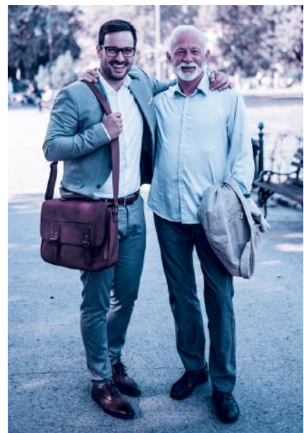
Finanzierung nach dem Umlageverfahren: zuerst einzahlen, später beziehen.