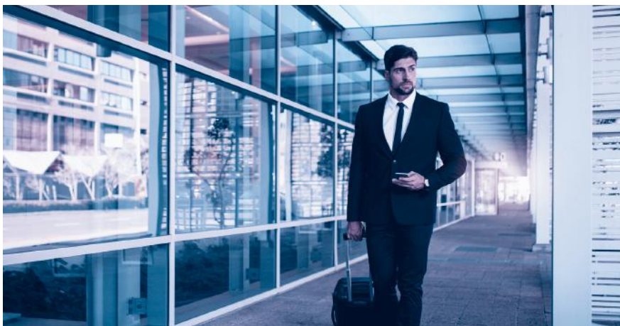
A1-Bescheinigung dabei? Sie ist für alle Aktivitäten im Ausland nötig.

entrichten hat. Es ist für sämtliche grenzüberschreitenden Tätigkeiten nötig, beispielsweise für Berater, Künstler, Journalisten oder Mitarbeiter im Transport oder Baugewerbe, und zwar auch dann, wenn der Aufenthalt nur wenige Stunden beträgt. Ausgestellt wird die A1-Bescheinigung von der AHV-Ausgleichskasse im Wohnsitzland des betroffenen Arbeitnehmers, beantragt wird sie vom Arbeitgeber des Entsandten bzw. direkt vom Selbständigerwerbenden.